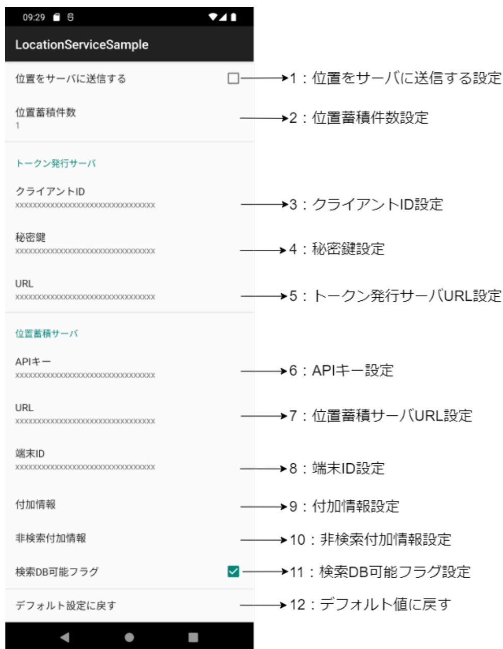
図 4. アプリ設定画面