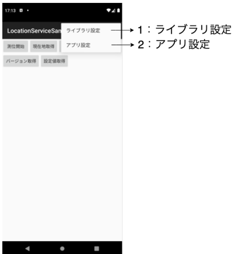
図 2. メニュー