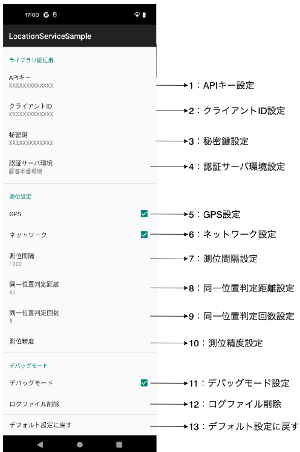
図 3. ライブラリ設定画面